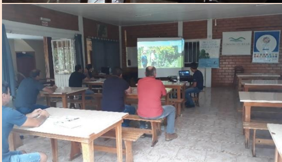
Registro fotográfico da reunião realizada em Guatambu/SC