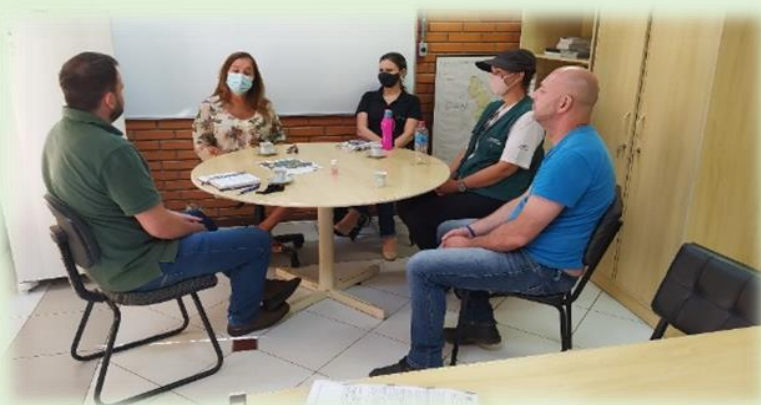
Registro fotográfico da reunião realizada na diretoria de agricultura e meio ambiente de Chapecó/SC