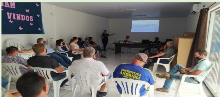
Registro fotográfico da reunião realizada em Águas de Chapecó/SC